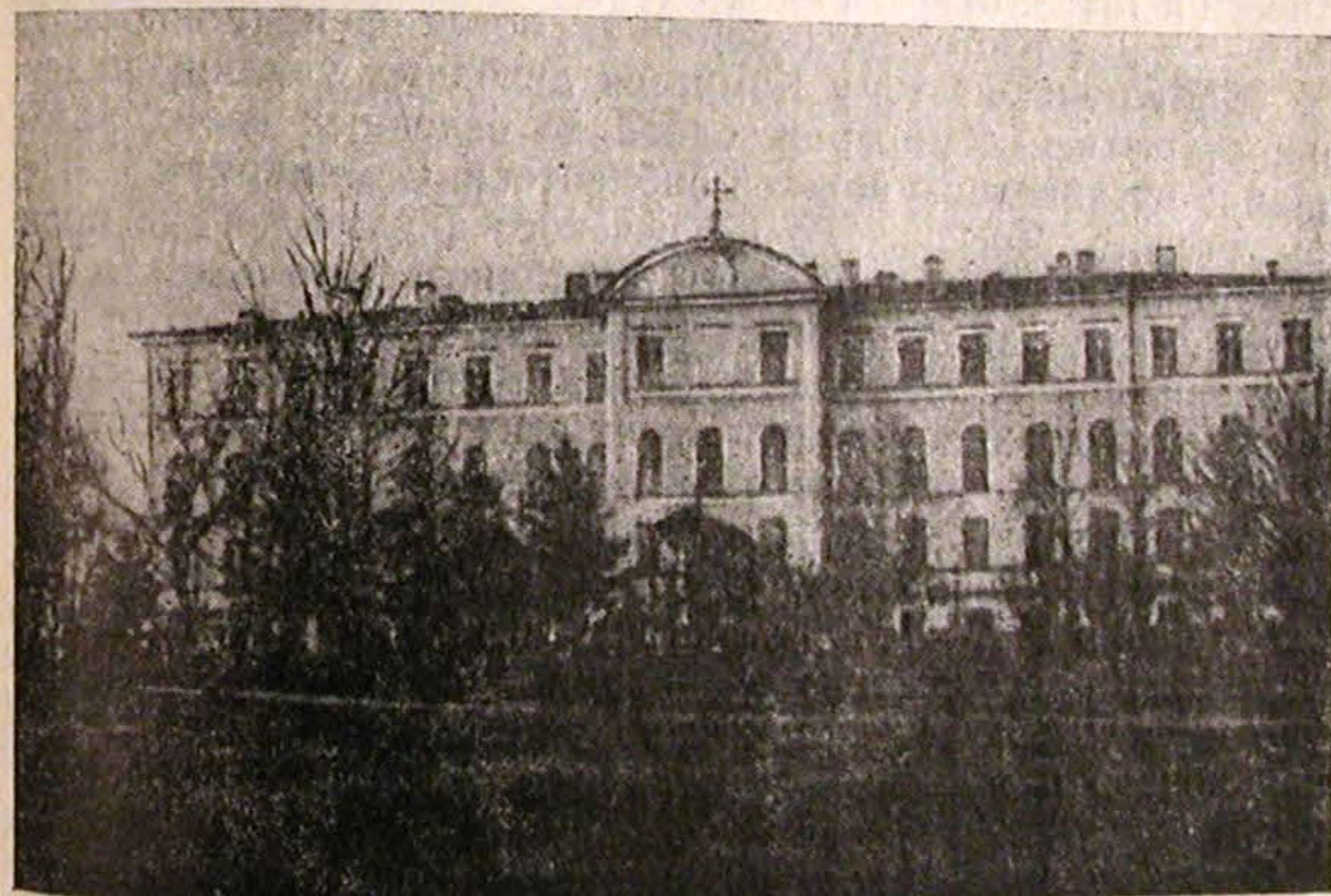
Олонецкая духовная семинария в г. Петрозаводске

Олонецкая духовная семинария была основана в г. Петрозаводске в 1829 г. 1 вскоре после учреждения Олонецкой епархии 2 и просуществовала, вероятно, до 1918 г. Семинария